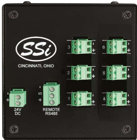
SR Módulo (Painel com 6 entradas)